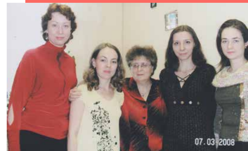
С сотрудниками отдела кадров Иркутского областного суда

расписаны на неделю вперед. Сейчас все свое время мы посвящаем нашей внучке – играем в ее любимые прятки, гуляем, занимаемся ее развитием. Внучка – наше солнышко, радость и счастье.