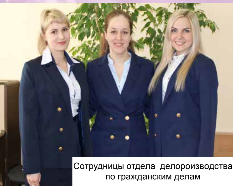
Сотрудницы отдела делопроизводства по гражданским делам