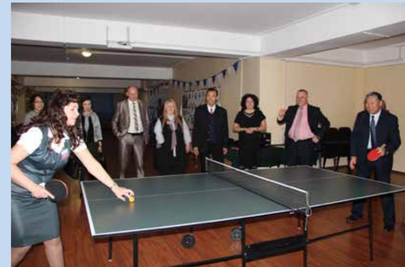
Пресс-служба Октябрьского районного суда г. Иркутска