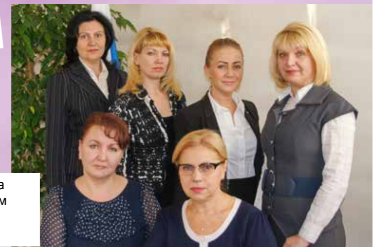
Судьи и сотрудники аппарата коллегии по уголовным делам I инстанция (г. Братск)