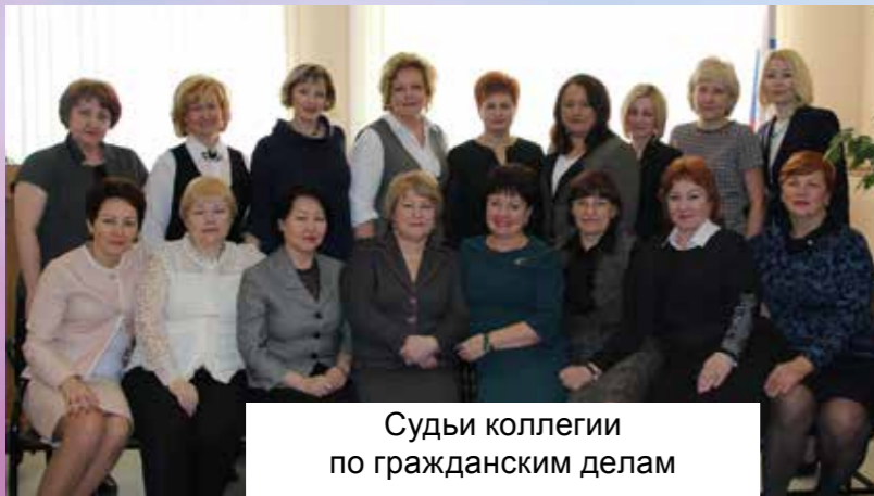
Судьи коллегии по гражданским делам