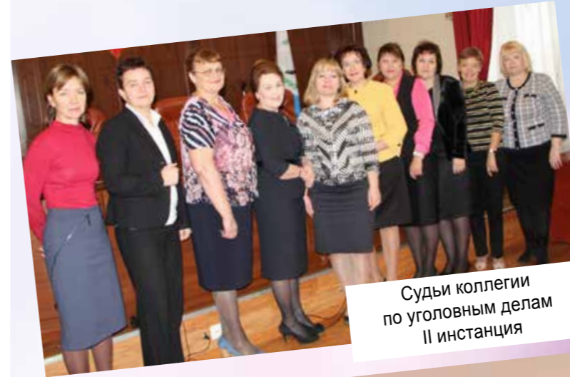
Судьи коллегии по уголовным делам II инстанция