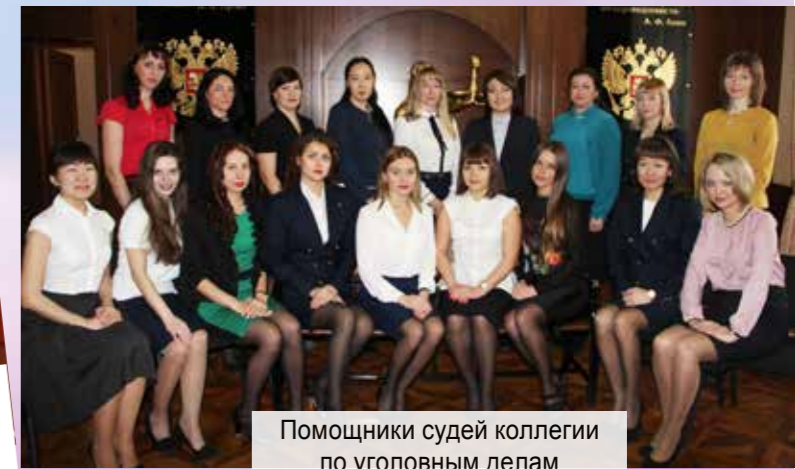
Помощники судей коллегии по уголовным делам II инстанция