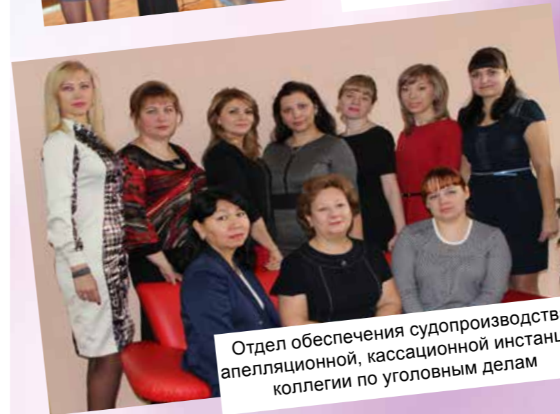
Отдел обеспечения судопроизводства апелляционной, кассационной инстанции коллегии по уголовным делам