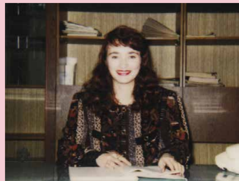
Подготовила Кристина БЕЙГАРАЗОВА, пресс-секретарь Иркутского областного суда