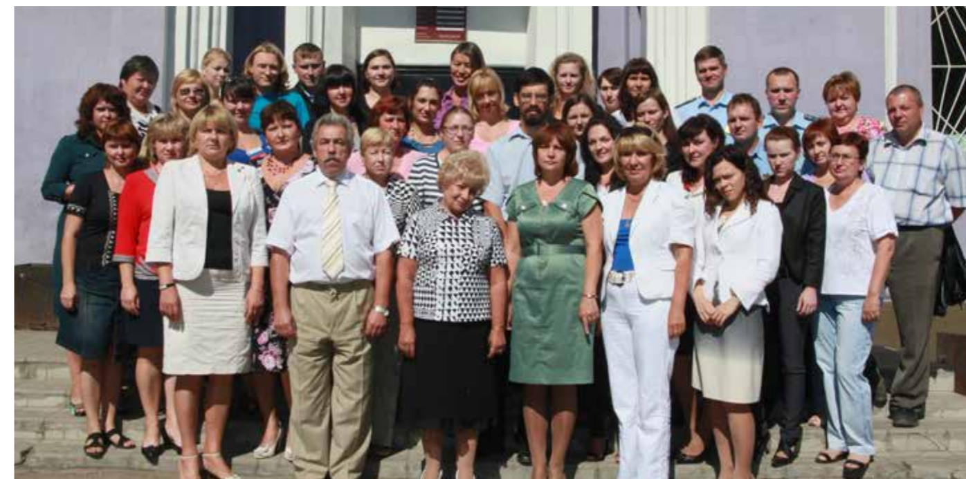
Коллектив суда в 2010 г.