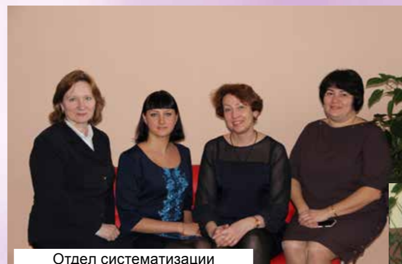
Отдел систематизации законодательства, статистики и обобщения судебной практики