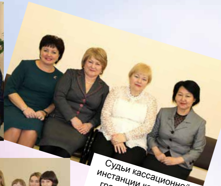
Судьи кассационной инстанции коллегии по гражданским делам