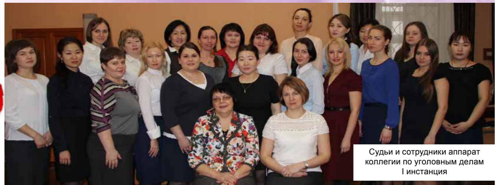
Судьи и сотрудники аппарат коллегии по уголовным делам I инстанция