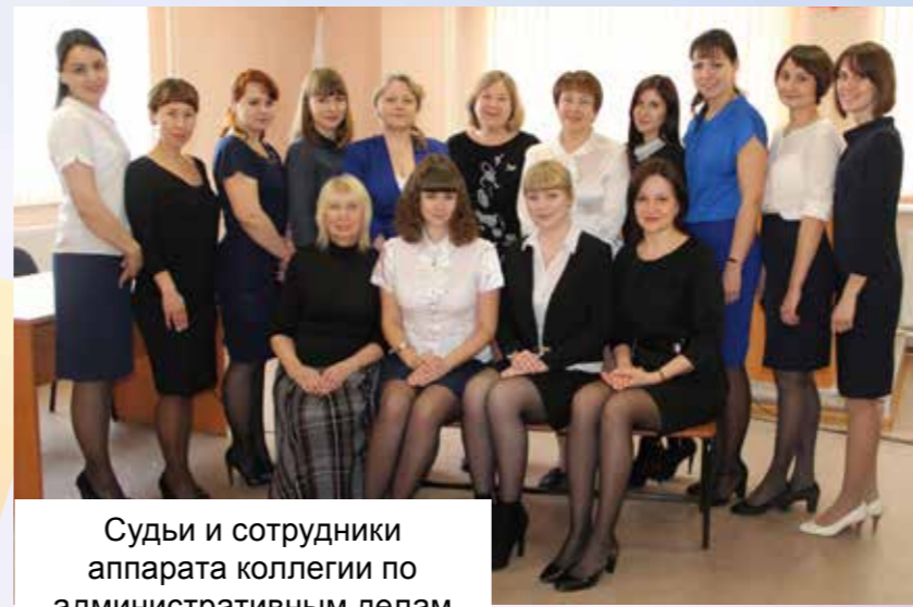
Судьи и сотрудники аппарата коллегии по административным делам